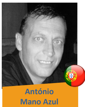
António Mano Azul